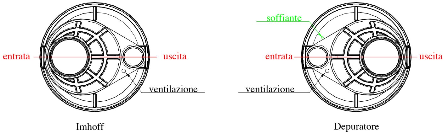
Fig.2 – Posizionamento collegamenti biogas e ossigenazione